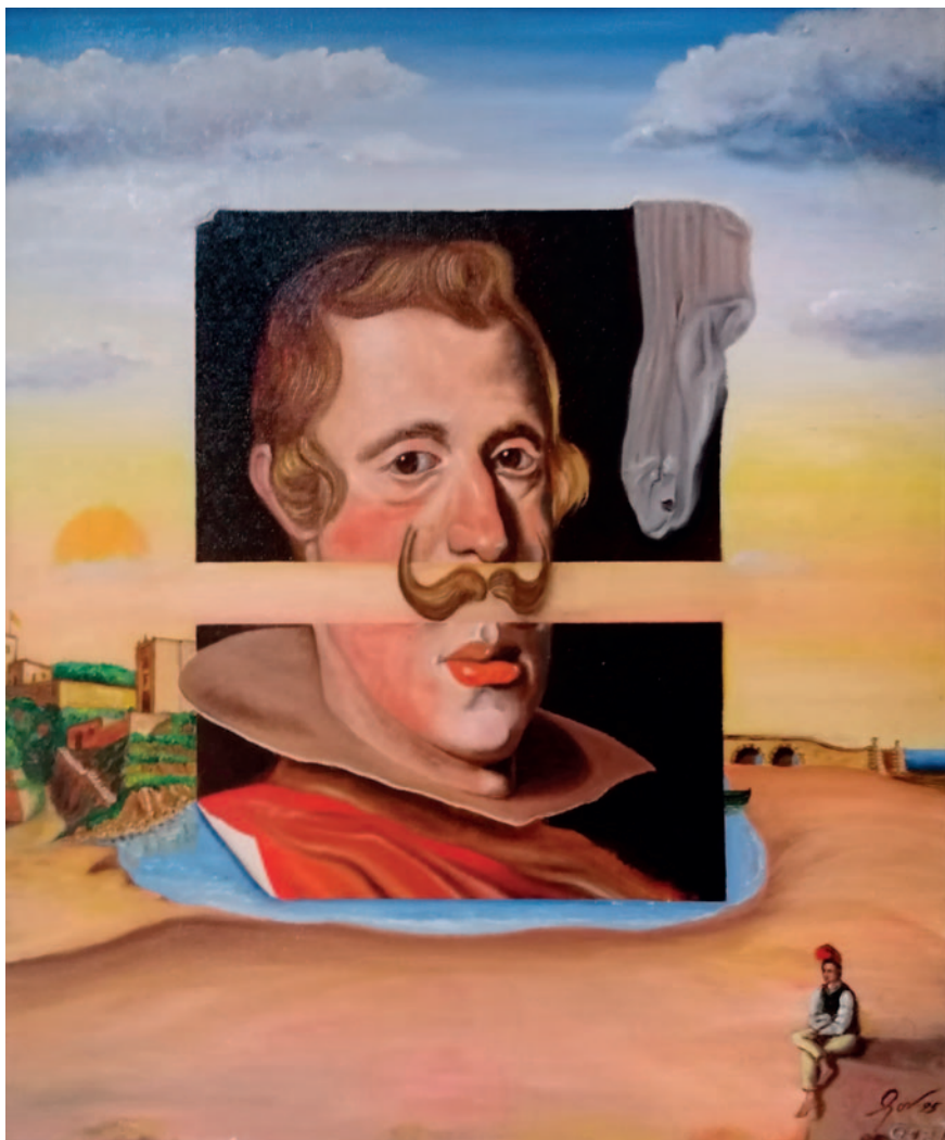
EL BIGOTI DE FELIP IV. Oli sobre tela (54 x 65 cm)