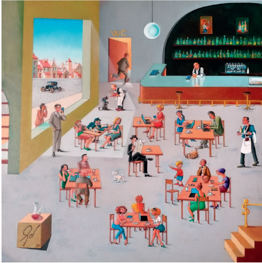
EL DISSIDENT. Oli sobre tela (80 x 80 cm)