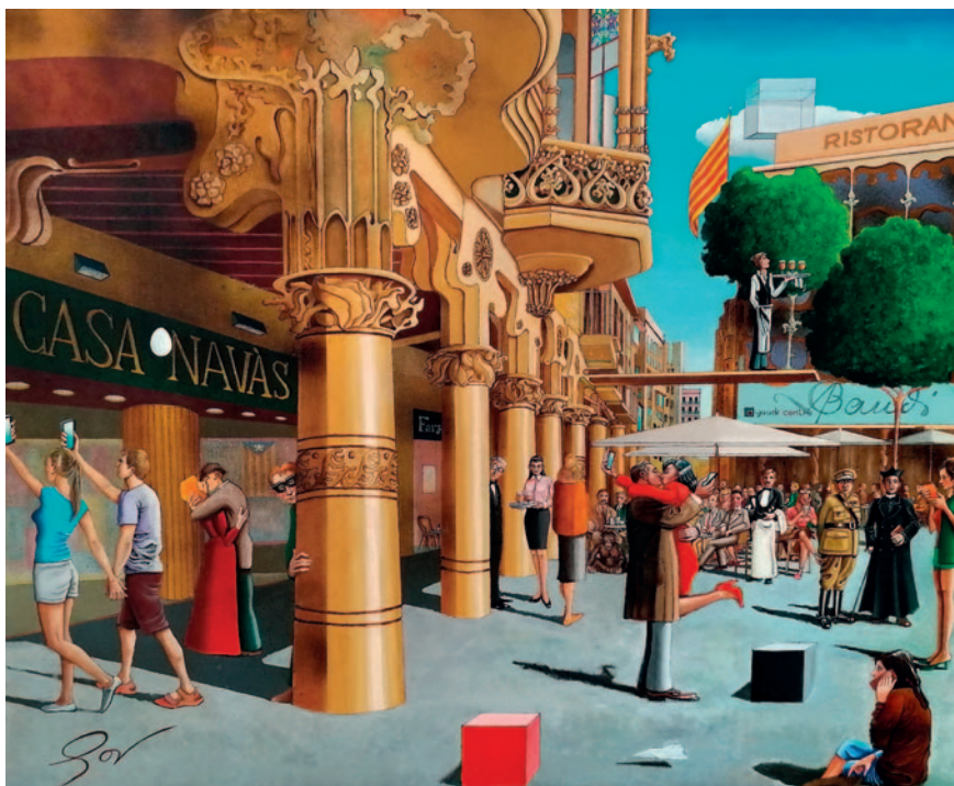
EL CANTÓ DE LA PLAÇA. Oli sobre tela (100 x 80 cm)