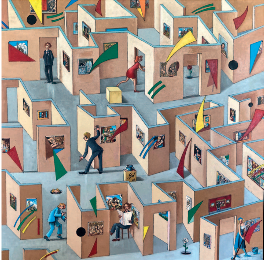
EXPOSICIÓN LABERÍNTICA. Oli sobre tela (60 x 60 cm)