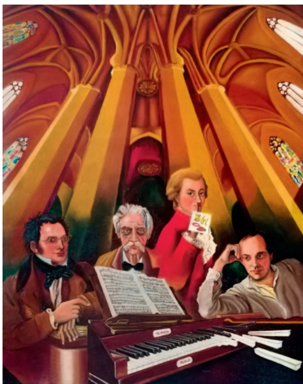
MÚSICA. Oli sobre tela (81 x 65)