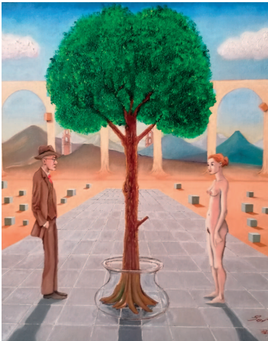
CONCUPISCÈNCIA DE DIA. Oli sobre tela (33 x 41 cm)