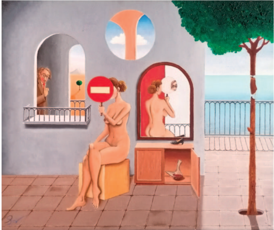
PROHIBIT. Oli sobre tela (33 x 41 cm)