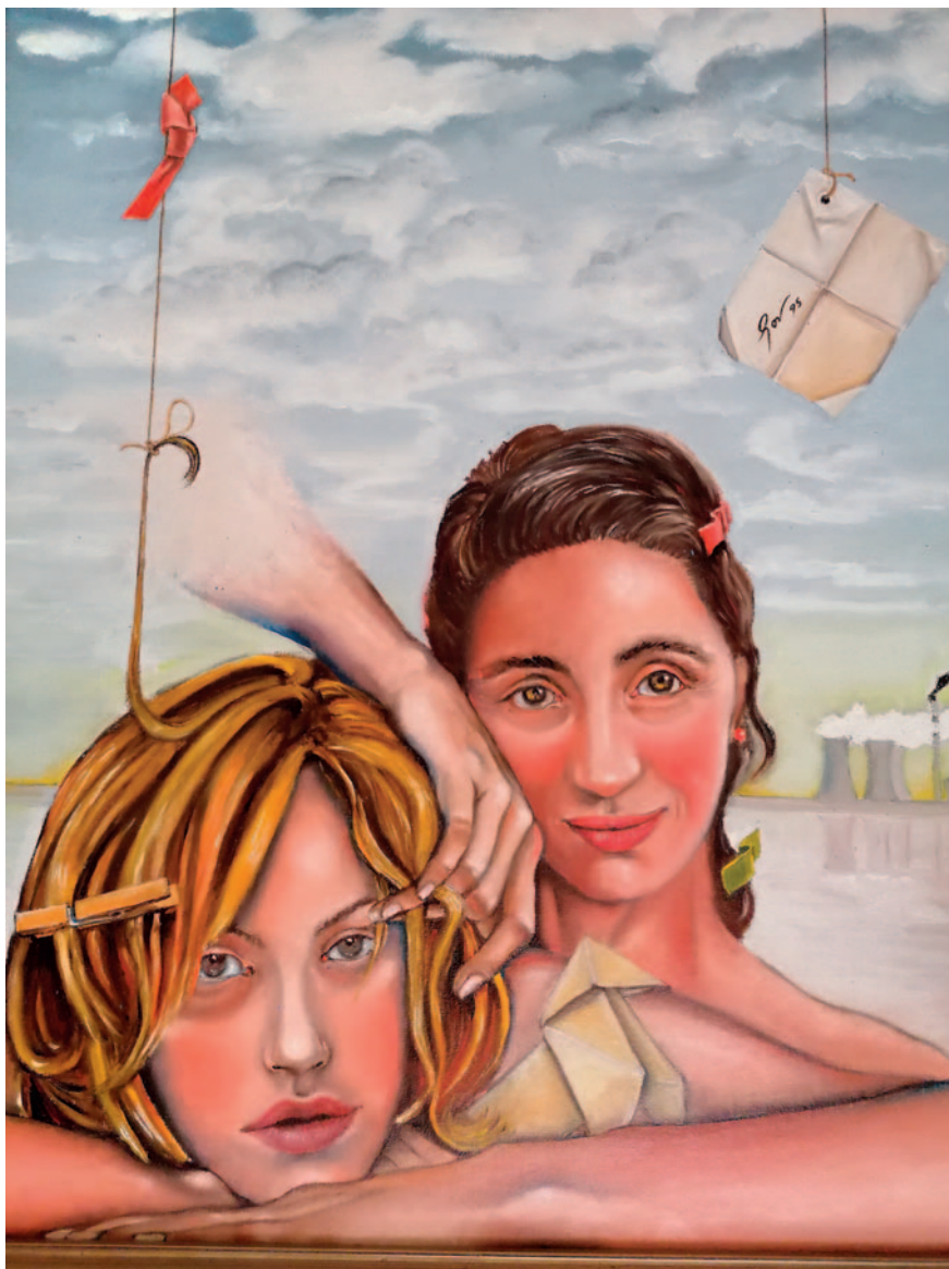
SERENA INQUIETUD. Oli sobre tela (55 x 46 cm)