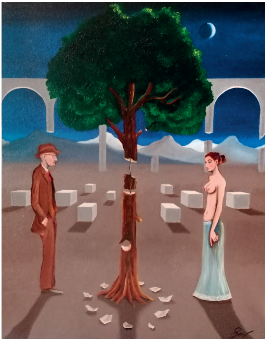
CONCUPISCÈNCIA DE NIT. Oli sobre tela (33 x 41 cm)