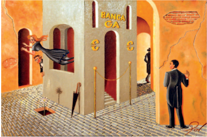
LA BANCA GA. Oli sobre tela (61 x 50 cm)