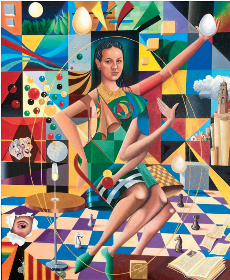
PERLA MARAGDA. Oli sobre tela (100 x 82 cm)