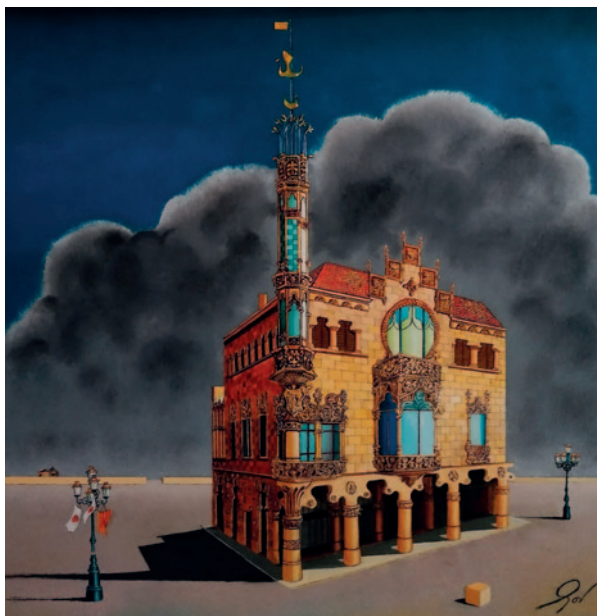
CAL NAVÀS. Oli sobre tela (70 x 70 cm)