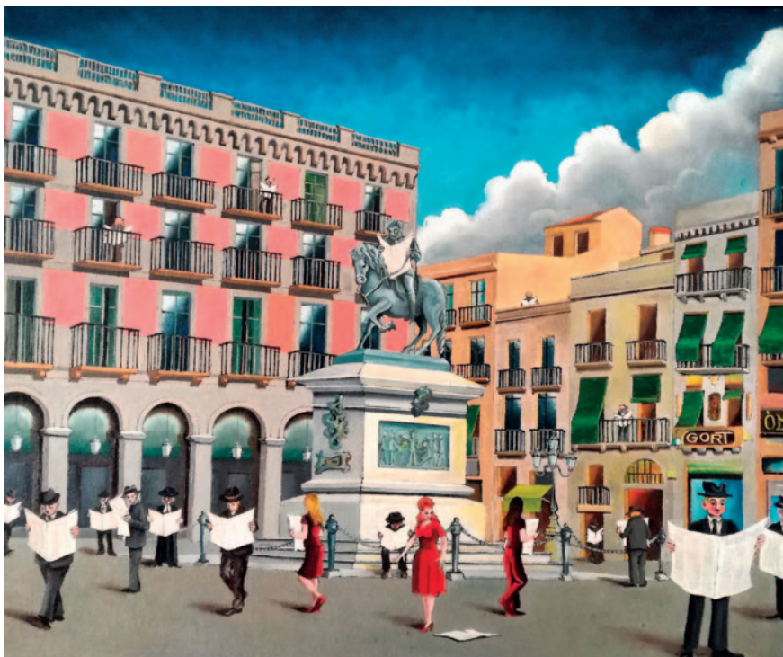
PLAÇA PRIM. Oli sobre tela (70 x 70 cm)