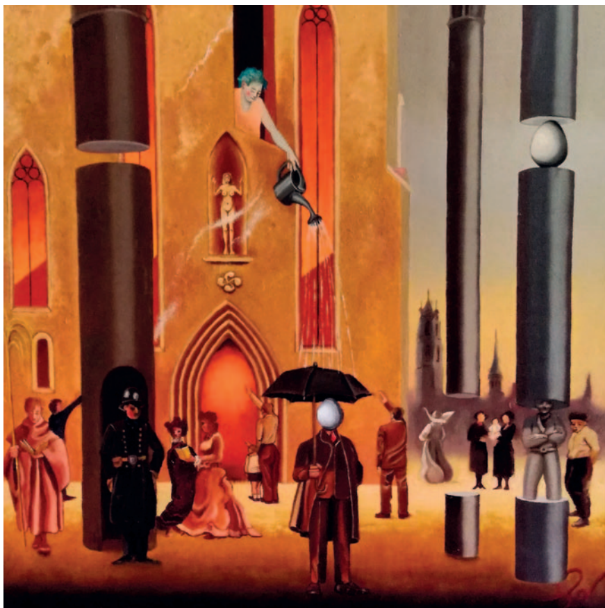
CONSPIRACIÓ A LA CATEDRAL. Oli sobre tela (50 x 65 cm)