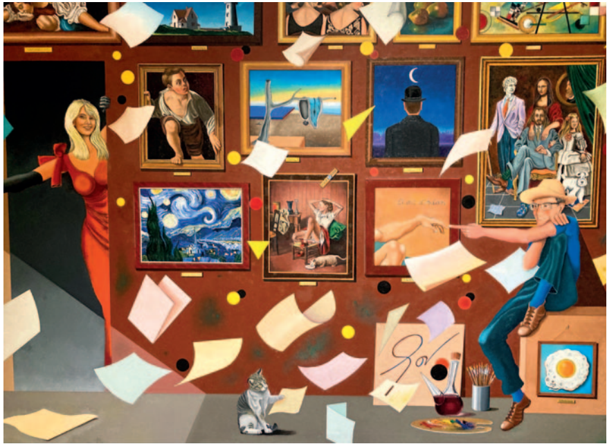
LA MUSA TREU EL CAP. Oli sobre tela (163 x 114 cm)