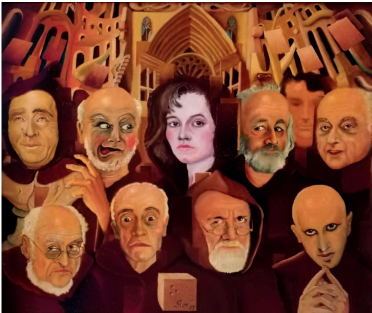
LAURA DELS ÀNGELS. Oli sobre tela (65 x 81 cm)