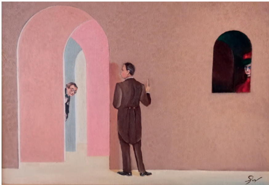
ESPIANT-SE. Oli sobre tela (33 x 41)