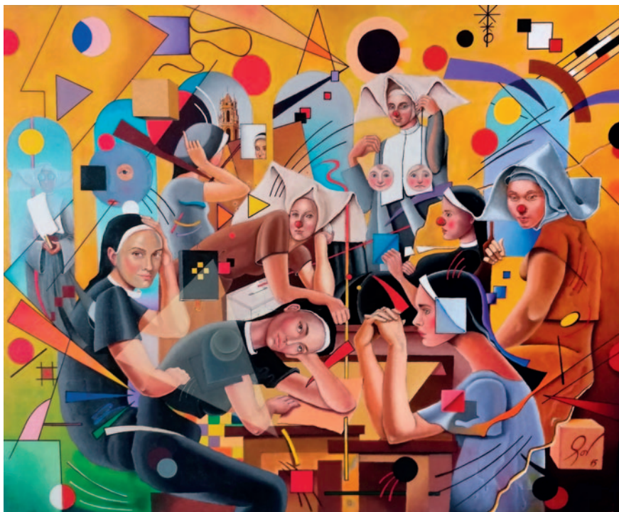
NUNS AS CLOWNS. Oli sobre tela (100 x 80 cm)