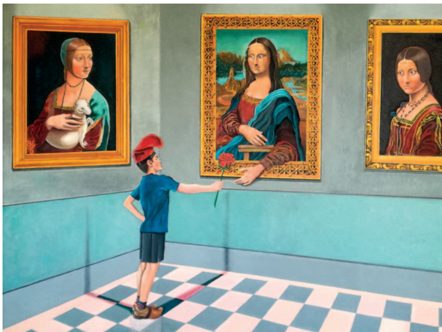
GENTIL PATUFET. Oli sobre tela (100 x 89 cm)