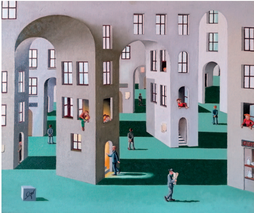
VILA CLOSA. Oli sobre fusta (58 x 46 cm)