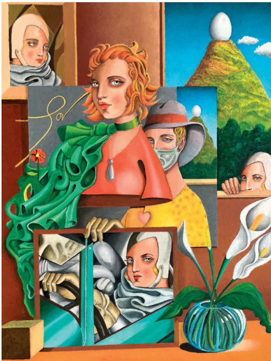
LEMPICKADA . Oli sobre tela (65 x 55 cm)