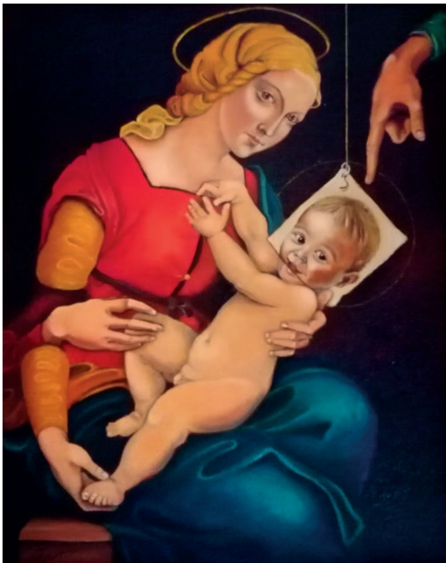
LA VERGE DEL RETRAT PENJANT. Oli sobre tela (50 x 61 cm)