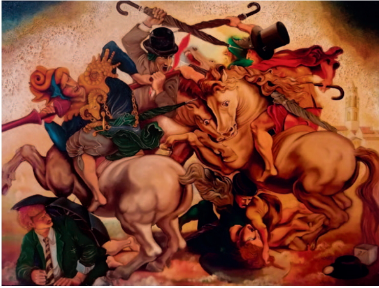
LA BATALLA D'ANGHIARI. Oli sobre tela (97 x 130 cm)