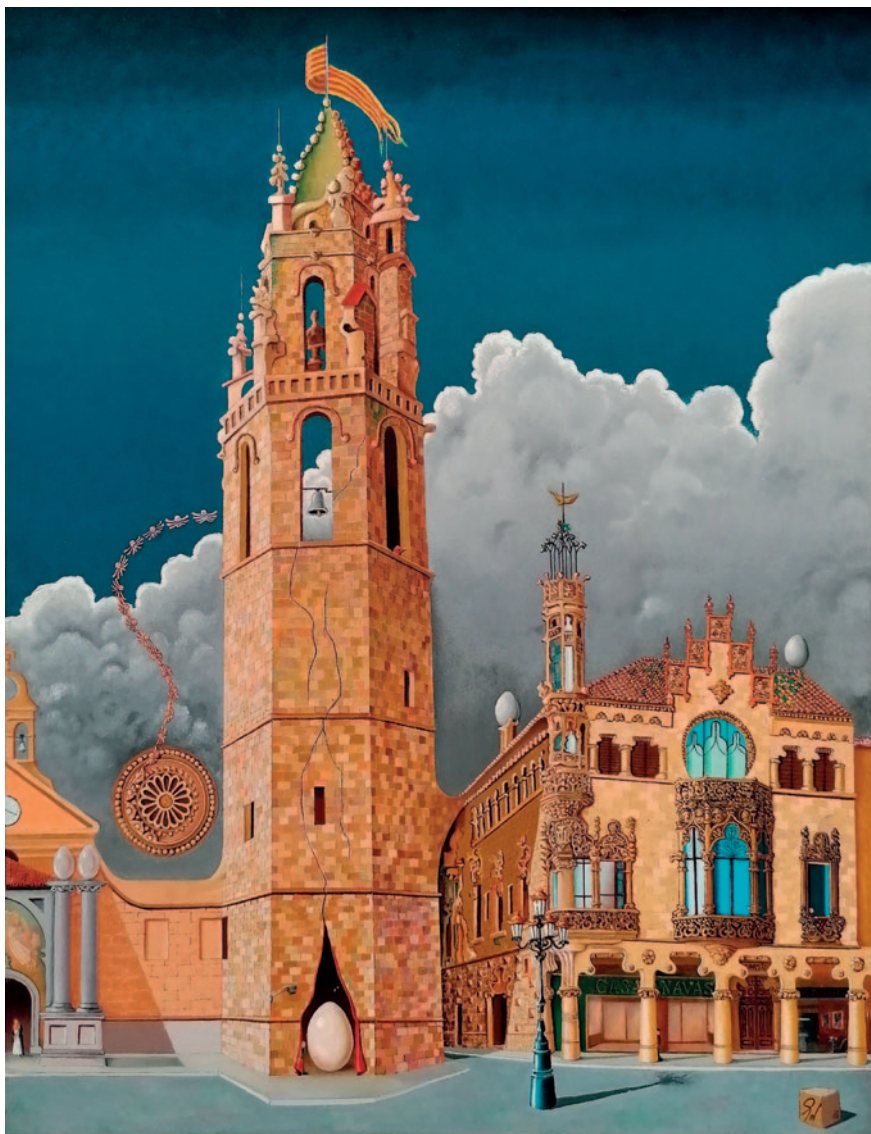
EMBLEMÀTICS. Oli sobre tela (100 x 81 cm)