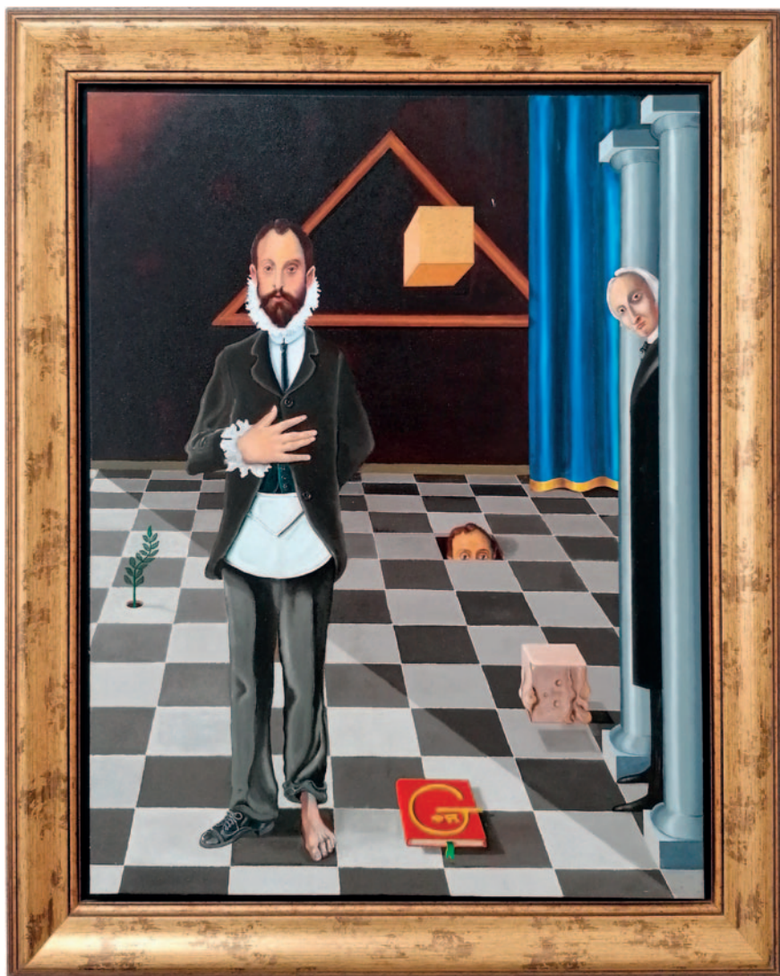
EL CAVALLER DE LA MÀ AL PIT. Oli sobre tela (100 x 82 cm)