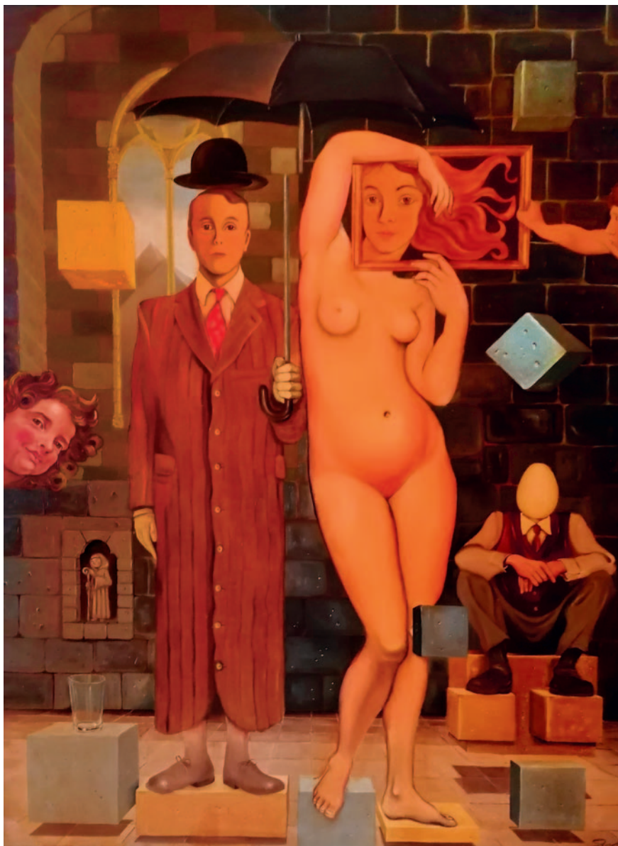
LA VENUS DEL QUADRE. Oli sobre tela (97 x 130 cm)