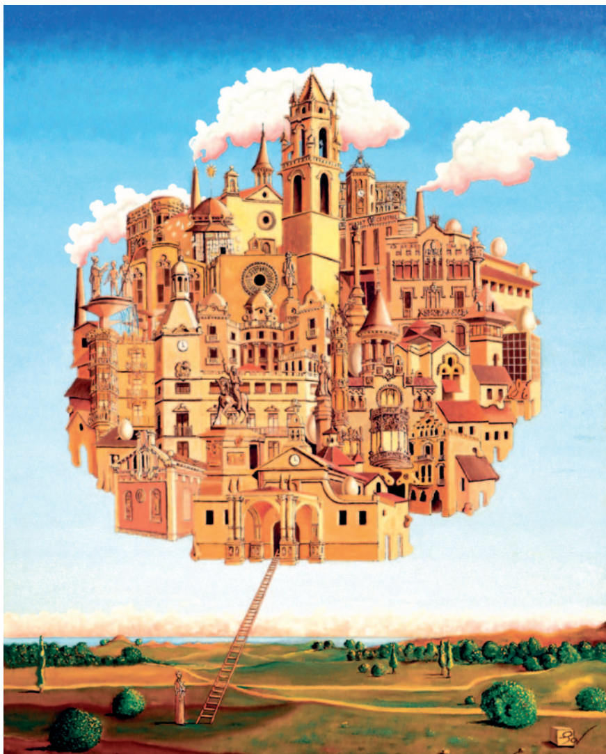
NOMÉS HI FALTES TU. Oli sobre tela (80 x 90 cm)