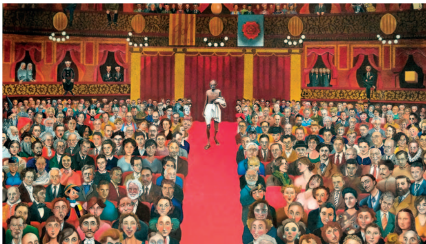
L'ESPECTADOR. Oli sobre tela (195 x 130 cm)